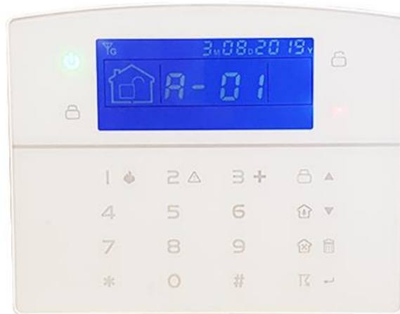
Teclado Táctil LCD